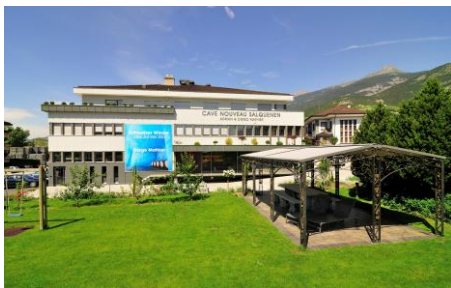
Gartenterrasse im Sommer/Herbst (max. 25 Personen)