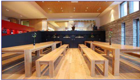
Kulinarium (max. 50 Personen)

Der einwandfreie Zustand des Degustationsraumes ist von grösster Wichtigkeit: Gut gelüftet, keine Fehlgerüche, still und eine gute Beleuchtung. Zudem stellen wir Mineralwasser und Brot zur Verfügung, um den Gaumen zwischen den einzelnen Weinen wieder aufs Neue neutralisieren zu können.