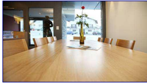
Lounge (max. 10 Personen)