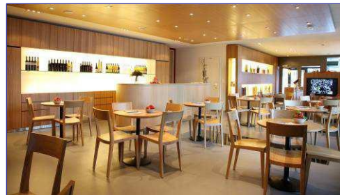
Stübli (für nicht geführte Degustationen)