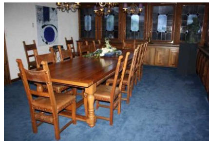
Salon Bleu (max. 20 Personen)

Die Degustation werden wir je nach Wunsch und Verfügbarkeit in unserem noblen Salon bleu, in unserer Lounge, auf der Gartenterrasse, unserem gemütlichen Stübli und für grössere Gruppen bis 50 Personen in unserem Kulinarium abhalten.