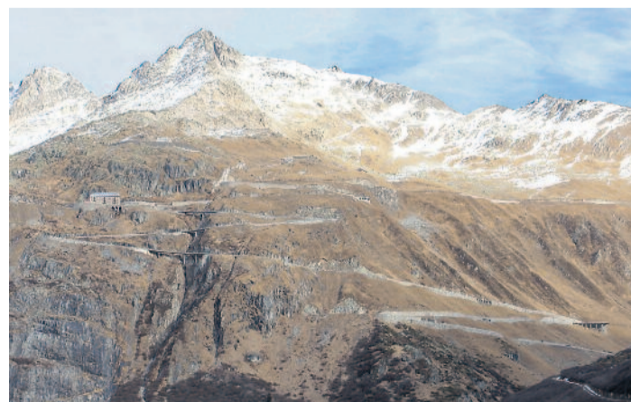
Lange Strasse, kein Verkehr. Noch nie war die Furka-Passstrasse derart lange offen wie in diesem Jahr.