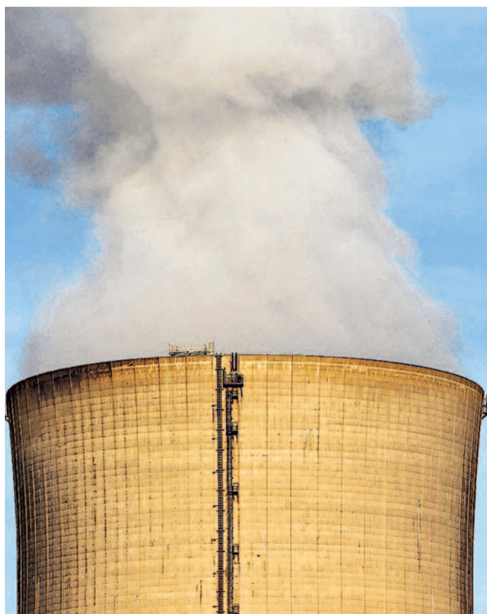
Atomausstieg. Der Bundesrat hat die Weichen für den Atomausstieg gestellt.